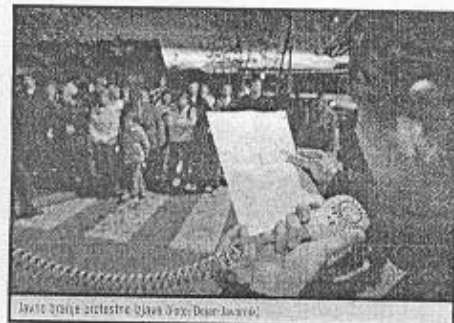
Javno stojijo protestne izjave.

Civilna iniciativa se je pred policijsko postajo še vprašala, ali je center popolnoma izgubil kompas, saj danes nihče, niti sorodniki, ne ve, kje sta oba otroka. Ne vedo, ali sta v redu, ali sta lačna, ali ju zebe... Zaradi neprimerno