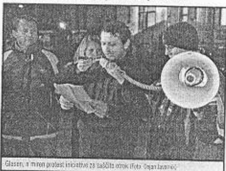
Glasi, in mirni protesti iniciative za zaščito otrok.