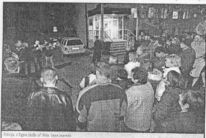
Policijska vloga služba se?