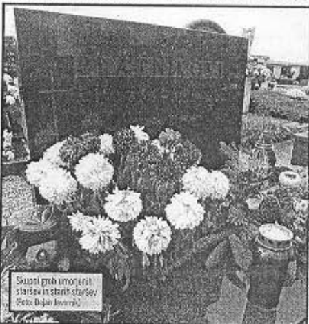
Skupni grob umorjenih staršev in starih staršev.