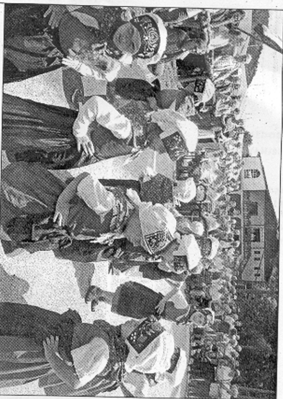
Na srečanju so nastopili tudi otroci limbuškega oddelka vrtca Studenci