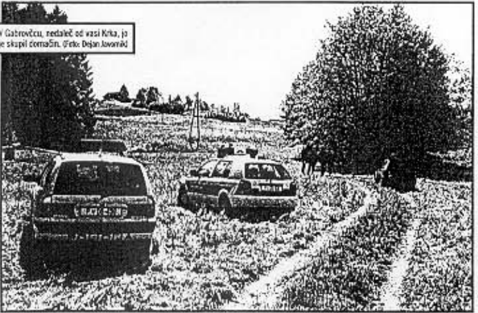
V Gabrovčcu, nedaleč od vasi Krka, je skupaj domačini.