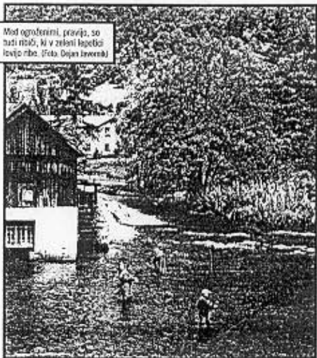
Med ogorčenimi, pravijo, so tudi mož, ki v zeleni legelbo lovijo ribo.

domačin. Dodal je, da je postalo smrtno nevarno. «Policija pravi, da ne morejo nič, da bodo svoje naredili, mi pa naj jih civilno tožimo. A se ljudje bojijo, če bi jih tožili, bi nas ubili. Ves čas grozijo: Mane so pretepli, s štangami