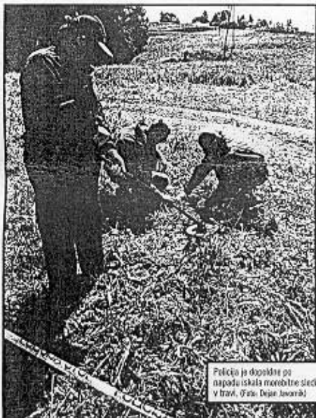
Policija je dogodke na napadu iskala morebitne sledi v travni.

pripeljal avto, čilo, ki se je z veliko hitrostjo namenil naravnost v skupino, če ne bi odskočili, bi marsikateri lahko končal pod kolese. Skupina je stopila vkup in avto prevrnila na bok. Takrat se je pripeljal tretje vozilo, kombi. Na travniku pod gozdom